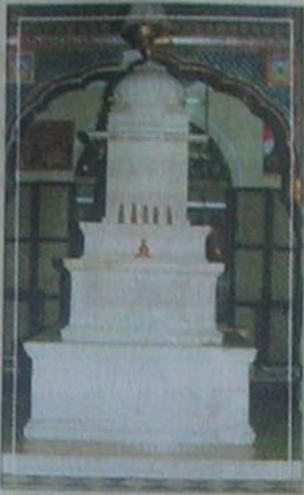
श्री दिगम्बर जैन मन्दिर खगरुवालान, जयपुर