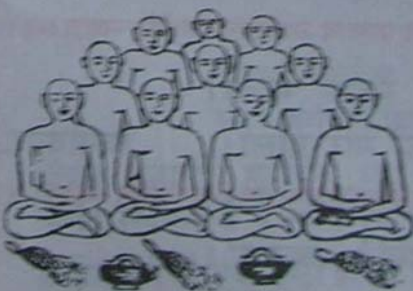
सर्वसाधुओं को नमस्कार