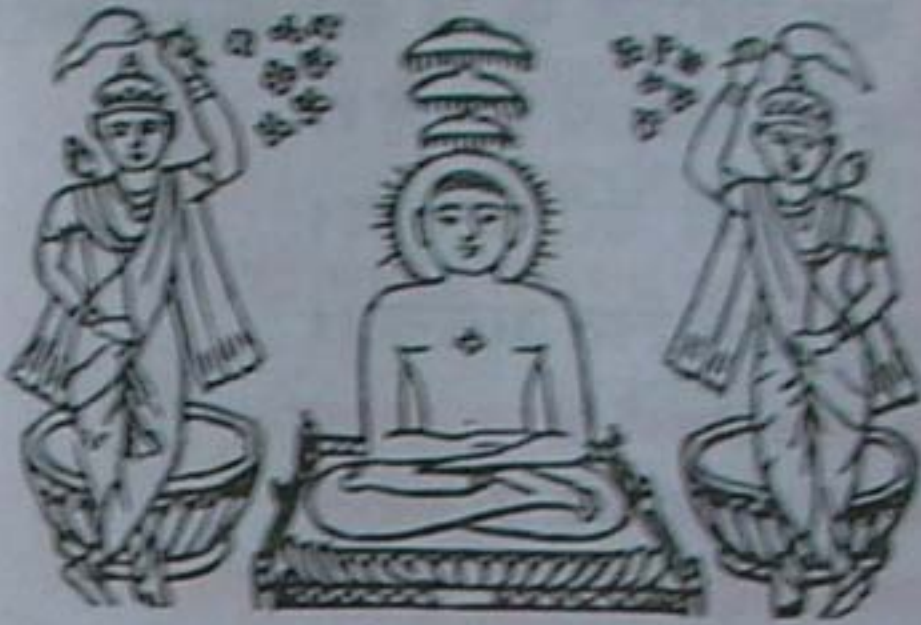
अरहन्तों को नमस्कार