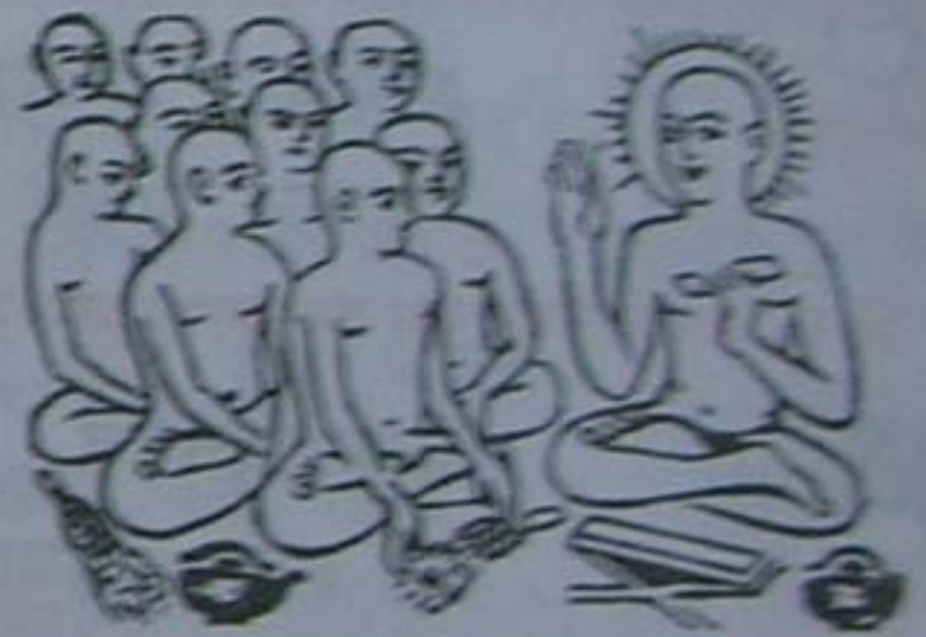
उपाध्यायों को नमस्कार