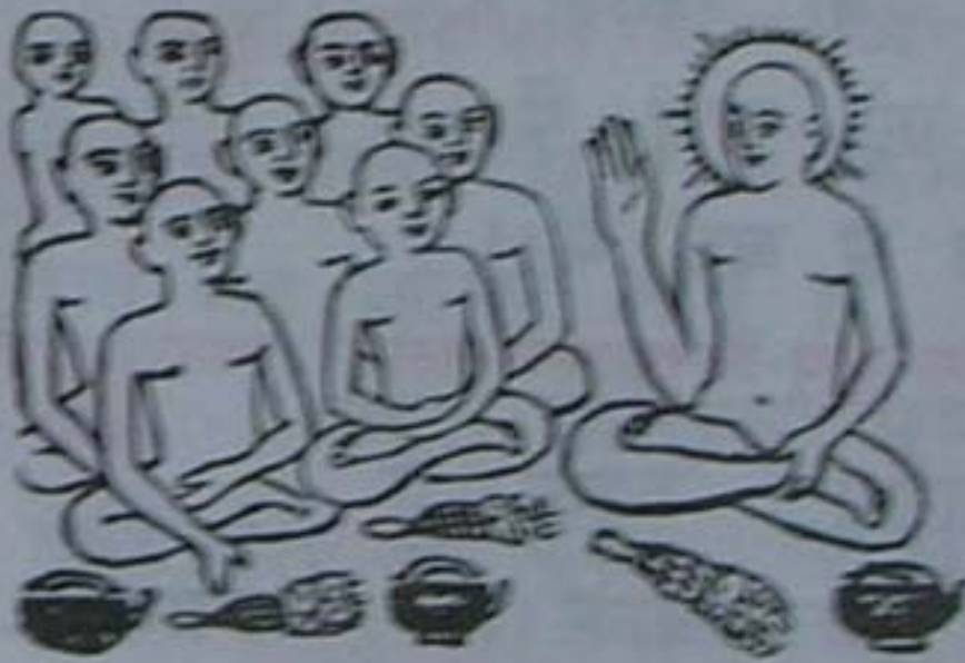
आचार्यों को नमस्कार